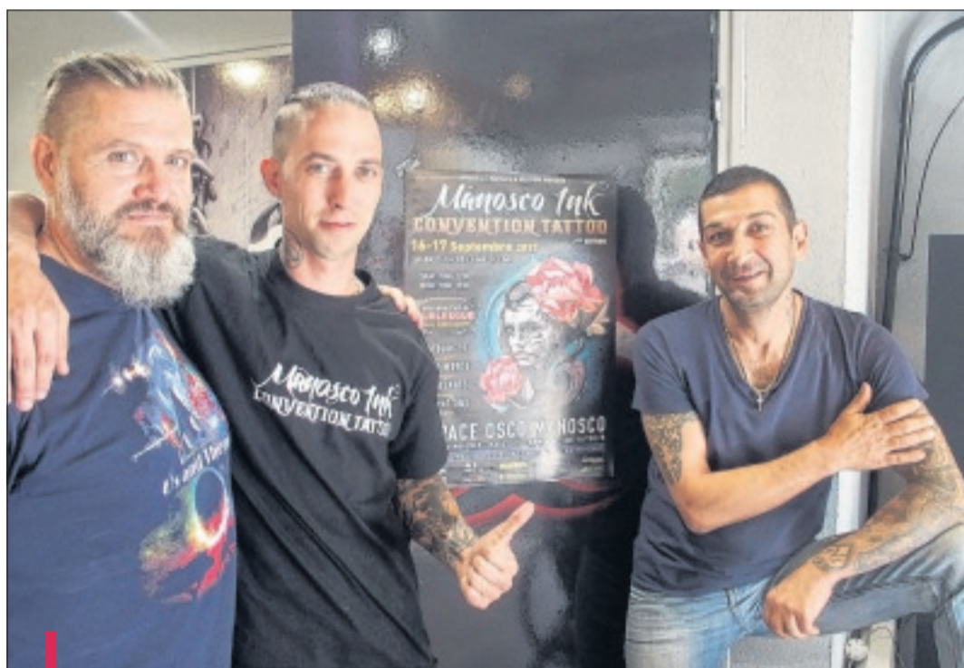
Ce groupe d'ami a eu l'idée il y a un an de faire une convention tatouage à Manosque. Plus de 2 000 personnes étaient présentes en 2016.

Pour ce Manosquin, la ville mérite un nouveau dynamisme et