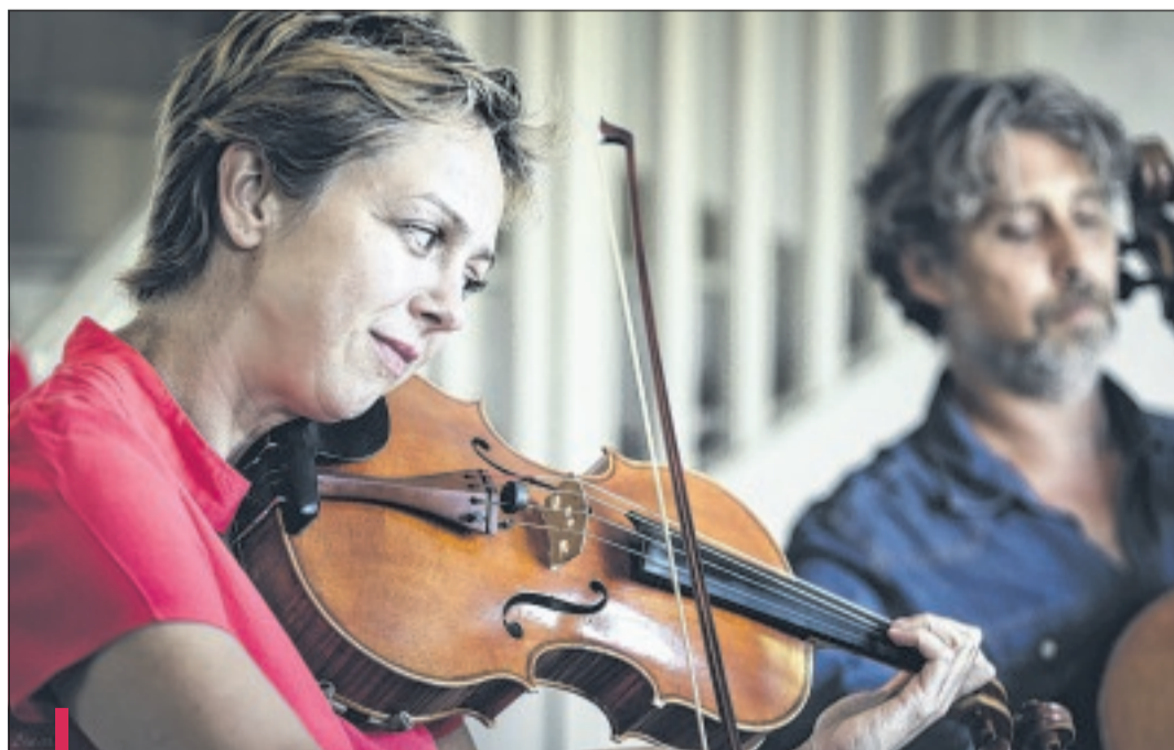
Traversée 9 interprétera des musiques de compositeurs russes et tchèques, au sein de l'église Saint Sauveur, demain soir.